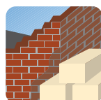
Materiales de construcción Hormigón, mármol, piedra, cemento, yeso.