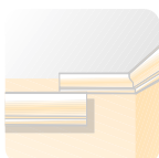
Molduras de escayola.