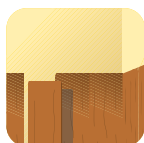
Paneles de madera.