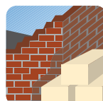
Materiales de construcción Hormigón, mármol, piedra, cemento, yeso.