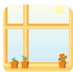
Fabricación de puertas y ventanas.